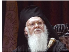
Его Божественное Всесвятейшество Архиепископ Константинополя— Нового Рима и Вселенский Патриарх ВАРФОЛОМЕЙ I