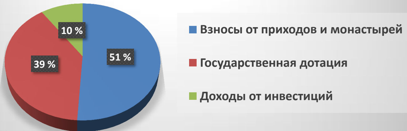
Средства центрального фонда церкви (2016 год)