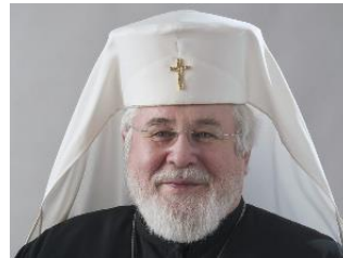
Его Высокопреосвященство, ЛЕВ, Архиепископ Хельсинки и всея Финляндии