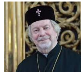
Находящийся на покое Его Высокопреосвященство, Митрополит АМВРОСИЙ