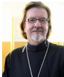
Находящийся на покое Его Высокопреосвященство, Митрополит ПАНТЕЛЕИМОН