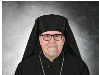
Его Высокопреосвященство, ИЛИЯ, Митрополит Оулу